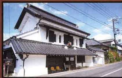
11 釜屋 土蔵造りの商家で質屋・金物屋を営業していた。