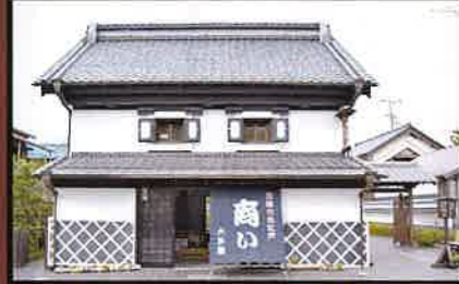
13 商い資料館 町並みの中心にあり、江戸～明治の資料が展示されている。 見学自由