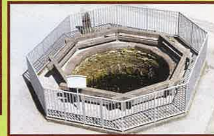
3 大井戸(県指定史跡) 忠勝公が掘ったもので、水が溢れたことがないと言われている。 深さ20m 周囲17m