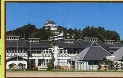
2 大多喜小学校 手前が大多喜小学校の校舎で、西側の高台の本丸跡に立つ大多喜城を見ることができる。