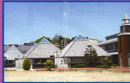
15 大多喜小学校 1997年 千葉県建築文化賞