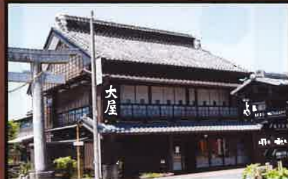
18 大屋旅館 国の登録有形文化財。 江戸時代から旅館として創業。