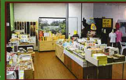
6 観光センター 館内 館内には各種観光パンフレットが置かれており、大多喜町の物産品やいすみ鉄道グッズなどが販売されている。