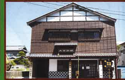
8 房総中央鉄道館(土日・祝日・開館、入館料有料) 動く鉄道模型、駅名板等、鉄道グッズ1,000点を常設。