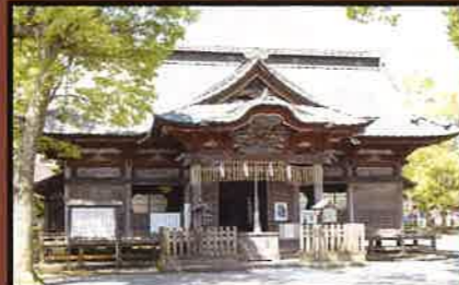
19 夷隅神社(町指定文化財) 歴代大多喜城主の崇敬社の一つで、現在の建造物は江戸時代末期のものと思われる。