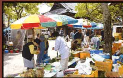
20 夷隅神社でおこなわれる朝市(六齋市) 毎月5と10のつく日に開催されている。(午前中)