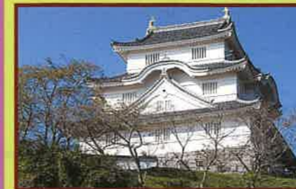
1 大多喜城(昭和50年復元) 徳川四天王の一人本多忠勝が1590年(天正18年)に築城。現在は改修工事の予定があり、休館中で館内は入れませんが、敷地内や研修館は見学可能です。