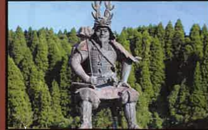
23 本多忠勝公銅像 行徳様の親柱に設置された忠勝像