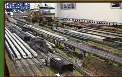
8 房総中央鉄道館 館内 館内に設置された鉄道のジオラマ。 日曜日開館、年末年始及び臨時休館あり。