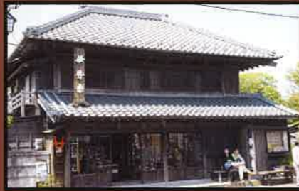
10 伊勢幸(酒店) 1872年(明治5年) 移築 大手門の材料の一部を使用して建築された商家で、屋根瓦に城主の紋所があった。