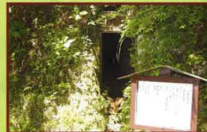
2 大多喜水道跡 千葉県最古の水道施設。江戸時代から計画され1870年(明治3年)に完成した。 水路総延長 5,760m