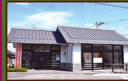
7 休憩 天然ガス記念館 館内には上総堀りの模型や、天然ガスに関する歴史等の資料が展示されている。 休憩、待合せにもご利用できる。