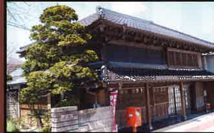
21 央倉邸 1874年(明治7年)頃 国の登録有形文化財。 醤油の醸造場所と商店兼住宅として建築された。