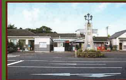
5 デンタルサポート大多喜駅 いすみ鉄道の本社と車両基地があります。