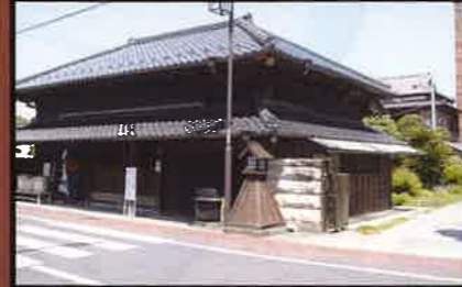
16 豊乃鶴酒造 1874年(明治7年) 国の登録有形文化財。 銘酒「大多喜城」の醸造元。