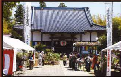
17 妙勝寺(ポタンの花) 花の見頃は4月中旬から下旬。