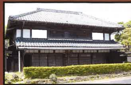
9 渡辺家住宅(国指定重要文化財) この建物は1849年(嘉永2年)に建築された江戸時代後期の町家である。