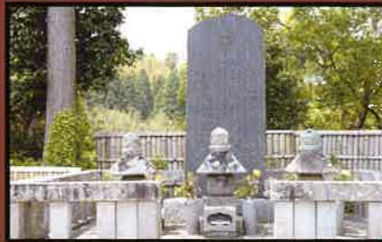
22 本多忠勝墓所(町指定史跡) 忠勝公(中央)、忠勝公夫人(右)、次男忠朝公(左)。