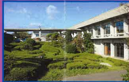
14 大多喜町役場(中庁舎) 1959年 日本建築学会賞 2013年 ユネスコ アジア太平洋遺産賞