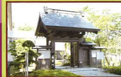
4 業医門(県指定史跡) 江戸時代中期の城内御殿の門。