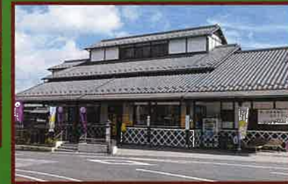
6 観光センター(観光案内所) 大多喜町の観光情報発信基地。 人力車(要予約)、超小型モビリティカー、レンタルサイクルなどが利用できる。 大多喜の土産が販売されている。