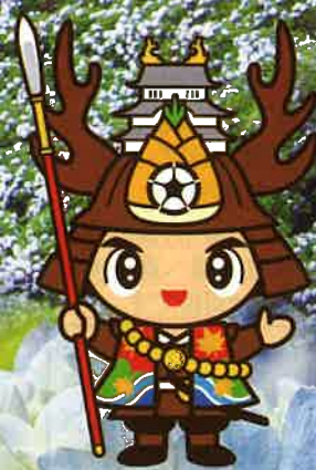
大多喜町シンボルキャラクター おたっきー